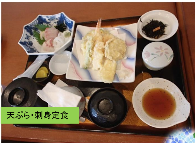
天ぷら・刺身定食