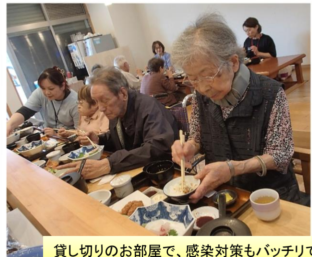
貸し切りのお部屋で、感染対策もバッチリです。