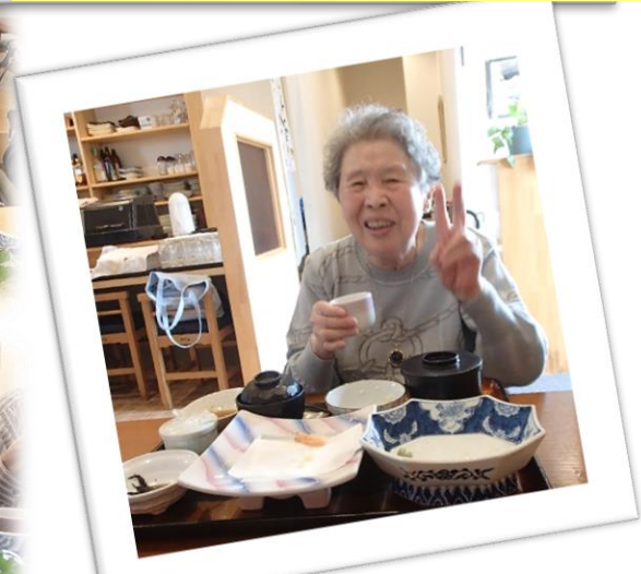
お膳にたくさんのお料理がありましたが、全部食べられました！！ 「また行きたい」とのお声を頂きました。